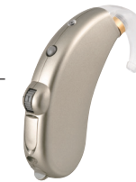
シャンパンゴールド