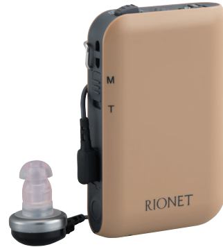
販売名 補聴器HA-43H 医療機器認証番号 305AABZX00046A01