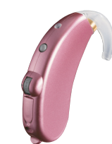
ピンクサファイア