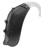
シャドーブラック