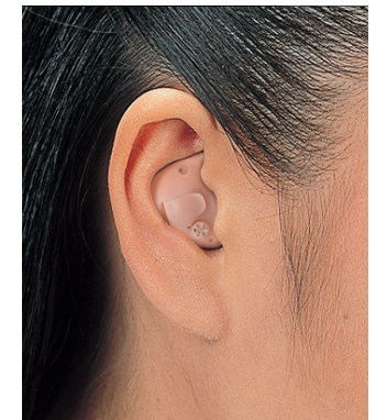
販売名 補聴器HI-89 医療機器認証番号 222AABZX00198000