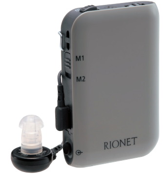
販売名 補聴器HD-34H 医療機器認証番号 303AABZX00058A01