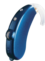
ブルーサファイア