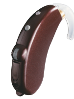
コーヒーブラウン