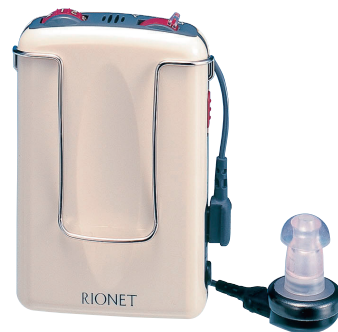
販売名 補聴器HA-76 医療機器認証番号 219AABZX00198000