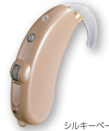
シルキーベージュ