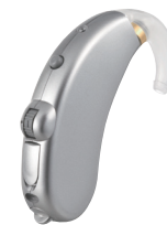
プラチナシルバー