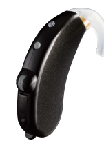
プレミアムブラック