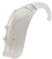
フレッシュブルー